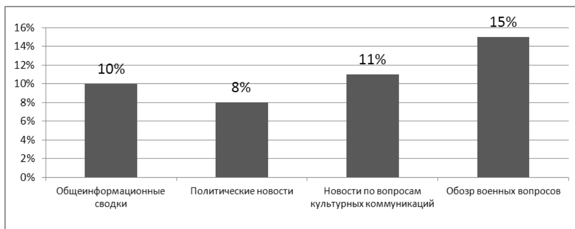
Рис. 1. Доля сообщений о миротворческих операциях по категориям новостных сводок в сети интернет, %.

Автором был проведён анализ средств массовой информации сети Интернет по вопросам освещения миротворческих миссий. Анализ заключался в изучении информационных сводок порталов СМИ (Красная звезда и др.) по различным разделам. Были выбраны основные рубрики, которые гипотетически могли содержать информацию о миротворческих миссиях. Были исследованы статьи по общим вопросам, политическим акциям, мероприятиям в сфере культуры и межкультурного взаимодействия разных стран и военным вопросам. По каждому разделу было просмотрено по 50 сводок за период 2011-2013 гг. (см. рис. 1).