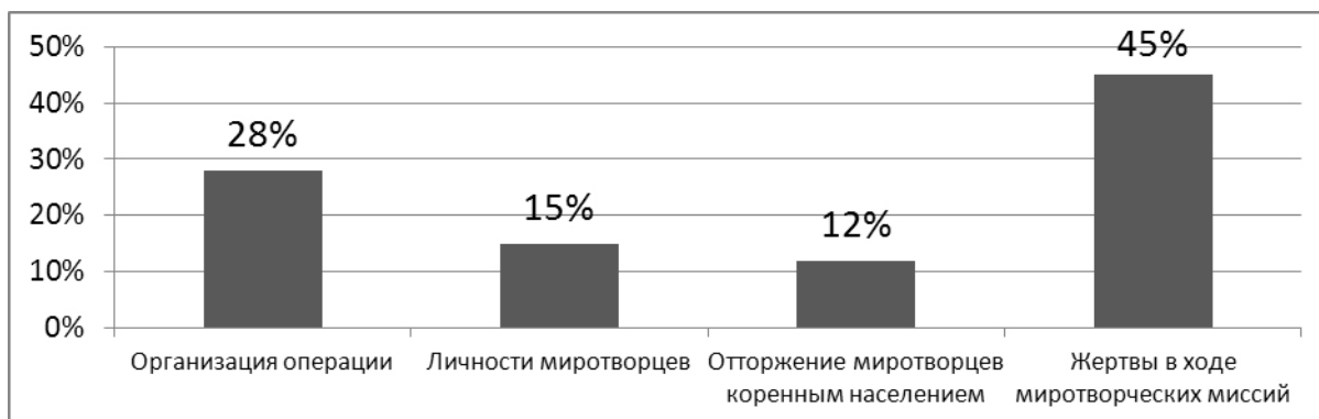
Рис. 2. Тематические направления публикуемых статей в сети Интернет по вопросам миротворчества, %.

всех сообщений данной категории), и организационные аспекты операции в количественном выражении (объём поставок, количество подразделений, численность контингента) (см. рис. 2).