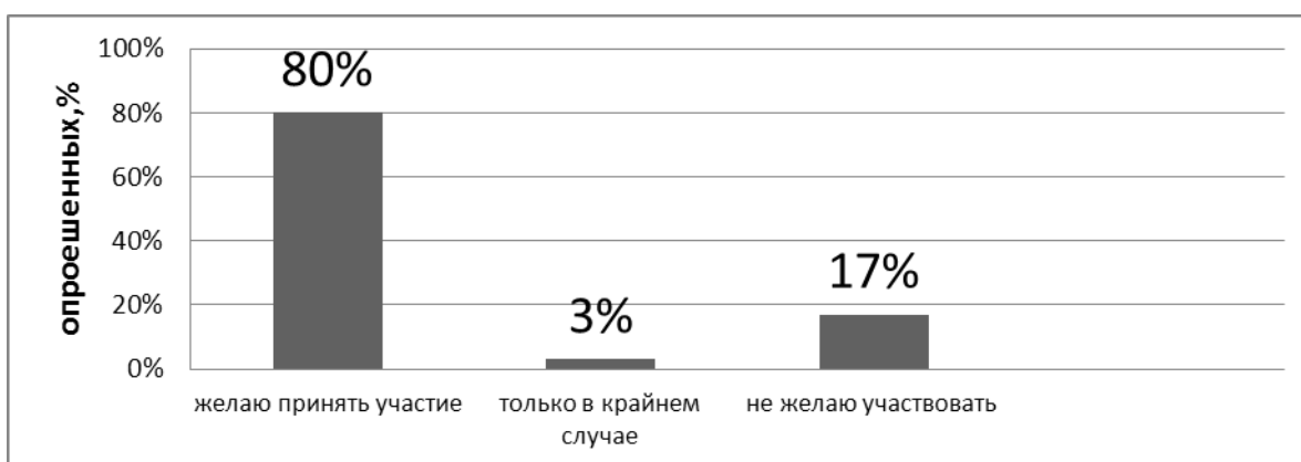
Рис. 3. Предпочтения курсантов относительно службы в миротворческих войсках, %.

Один из наиболее важных вопросов, которые задавались курсантам, был сформулирован следующим образом: «Хотели ли бы вы служить в миротворческих войсках?» (см. рис. 3).